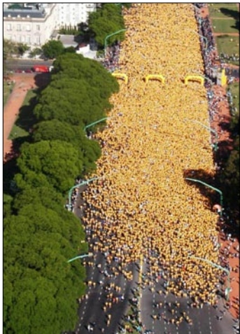
A TROTAR. Se esperan 25 mil corredores en los Palermo.